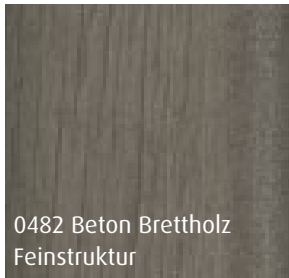
0482 Beton Brettholz Feinstruktur

KO80 Aluminium-Haustür, Typ 1 flg. nach innen öffnend, ausgestattet mit 3-fach Verriegelung und 3 Stck. Designtürbändern. Maße maximal 1150 x 2250 mm und weiterer beschriebener Ausstattungsdetails.