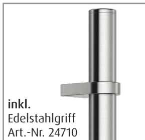
inkl. Edelstahlgriff Art.-Nr. 24710

Alle Haustürserien sind ohne Aufpreis mit dem KABA expert Profizylinder ausgestattet